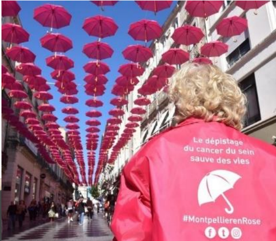
Illustration à Montpellier